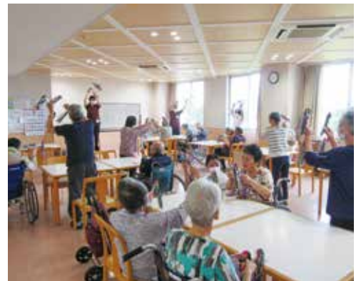
たの ぎ 楽し木体操の様子

その他、全員で遊べる簡単なゲームや楽し木体操を行い、作り立ての紅白饅頭を食べて、楽しいひと時を過ごすことができました。これからも元気でお過ごしください！