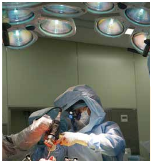
ロボティックアーム手術支援システムを使った手術の様子

腫瘍の治療方針を決めるにあたり、良悪性の鑑別が大切です。悪性腫瘍は、痛みを伴うイメージがあるかもしれませんが、 軟部悪性腫瘍の多くは痛みを伴いません 。また、小さくても悪性のことがあります。そして、 まず刺してみる は腫瘍播種の危険があり、 まず取ってみる は、腫瘍の範囲を広げ、再発すると