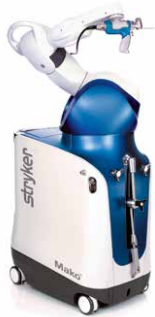
膝関節置換術に用いるロボティックアーム

整形外科は、骨、関節、靭帯、筋肉、腱、神経などの運動器の疾患を診断、治療する分野です。運動器疾患には、外傷（骨折、脱臼、創など）、変性疾患（脊椎症、変形性関節症）、腫瘍、および代謝性疾患（骨粗しょう症、くる病、骨軟化症など）があります。主な疾患である骨折や、脊椎・関節の変性疾患に対する手術や保存療法はもちろん、骨軟部腫瘍や骨粗しょう症を含む代謝性疾患の診療も行ってまいります。人工膝関節置