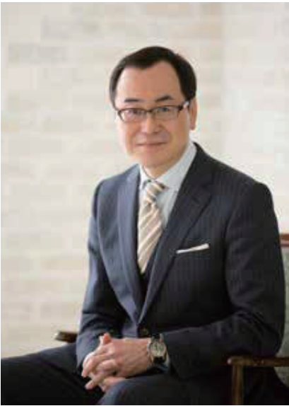
公益財団法人湯浅報恩会 理事長

電子書籍やSNSが一般的となるにつれて、印刷物としての書籍や雑誌は苦境に立たされ、廃刊に追い込まれるものも少なくありません。それでも私たちは、手に取って開いていたときに小さな温もりが伝わるようなささやかな広報誌を、これからも心を込めてお届けしていきたいと思えます。