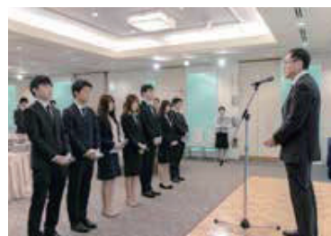
理事長から研修医へ向けて

活を振り返りながら、今後の抱負などが述べられました。協力病院の先生方、当院の指導医の先生方他、関係者が一堂に会し、和やかな雰囲気の中で歓談のひとときとなりました。研修生活で遅しくなられた先生方の、益々のご活躍を祈念しております。 (総務課)