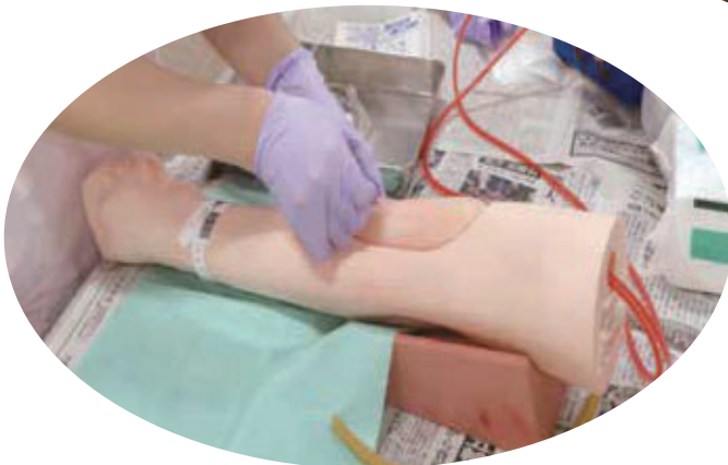
シミュレーターを使用して採血の演習をしているところです