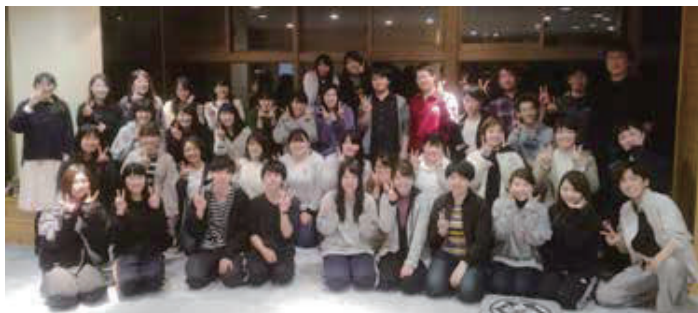
新潟大学合唱団と記念写真