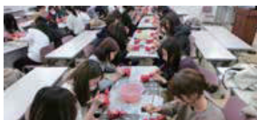
赤べこ絵付けの様子

迷い悩むこともあると思いますが、そのような時こそ一人で悩まず、同期の仲間と相談し支え合いながら、ひとつひとつ困難を乗り越えていけることを願っております。(人事課)