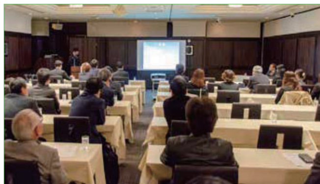
〈歯科口腔外科症例懇話会〉