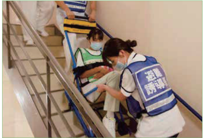
〈イーバッグチェア搬送訓練〉