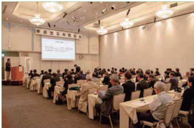
〈忘年懇話会の様子〉

今回、多くの方々にお集まりいただきましたこと、さらには講演が盛大に開催できましたこと心より御礼申し上げます。