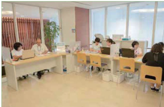
〈専門のスタッフがお待ちしてしております〉

入院前の確認により、準備できることもあります。些細な事でも構いませんので、気になることや不安に思っていることはご相談ください。