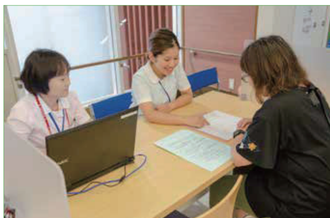
〈お気軽に相談してください〉

入退院サポートカウンターは、外来と病棟を繋ぐ場所として、患者さんに寄り添った対応ができることを目指しております。