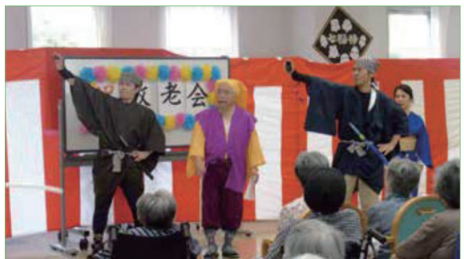
〈このもんどころが目に入らぬかーっ!〉