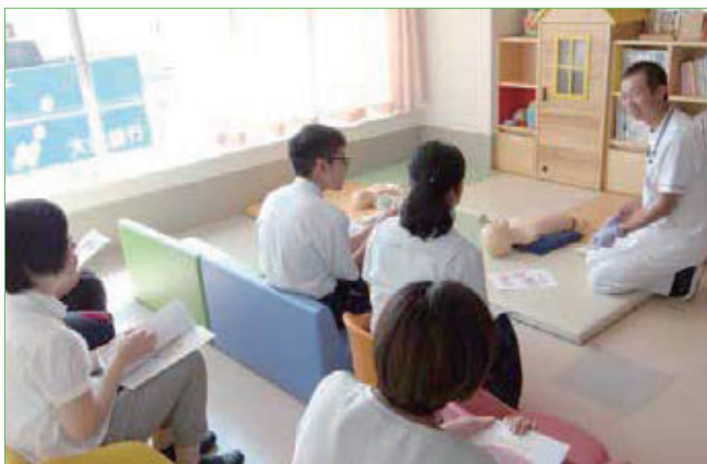
〈小児対象講習会の様子〉