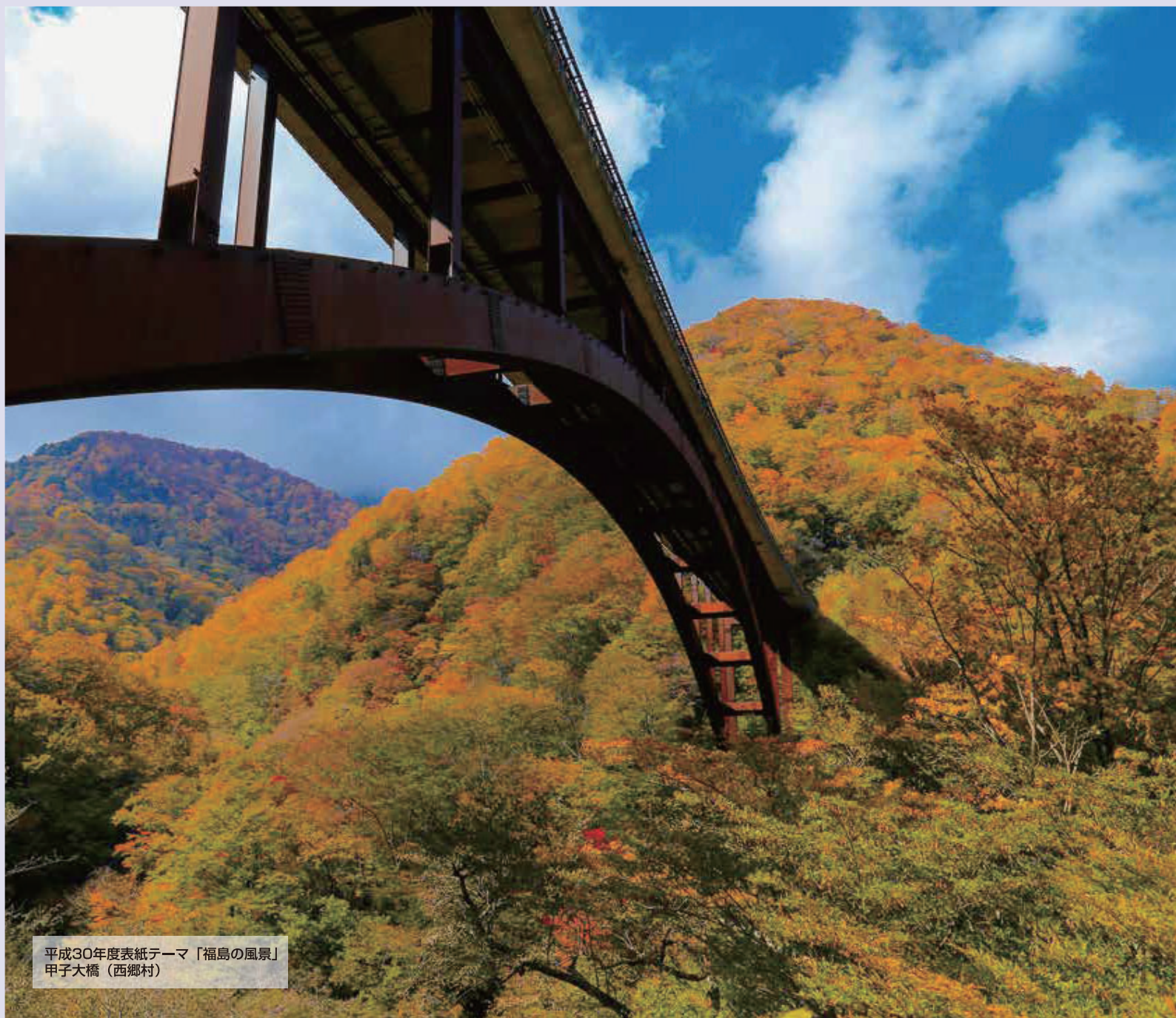
平成30年度表紙テーマ「福島の風景」 甲子大橋（西郷村）