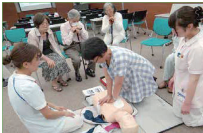
〈成人対象講習会の様子〉