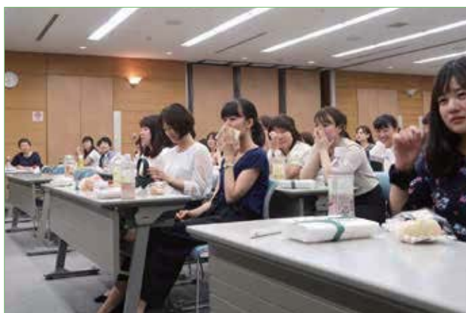
〈応援メッセージを聞いて感激している場面〉

次は、「頑張れ応援メッセージ」です。事前に新会員の両親や同居家族の方へ、応援メッセージの手紙を依頼し返信のあった手紙の中から、代読の許可を頂いた方のみ部署責任者がメッセージを読み上げました。どの家族の方も、自分の子どもに手紙を書く機会は少ないようで、看護師を目指して頑張っていたことや、慣れない我が子の姿にエールを送る内容に、新会員は目に涙を浮かべていました。