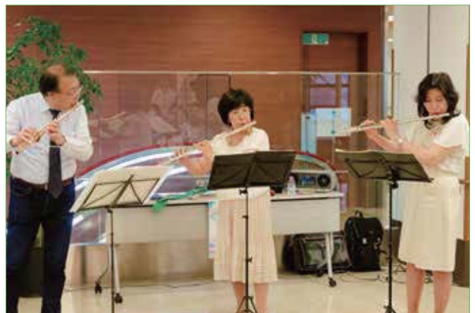
〈フルートの三重奏〉