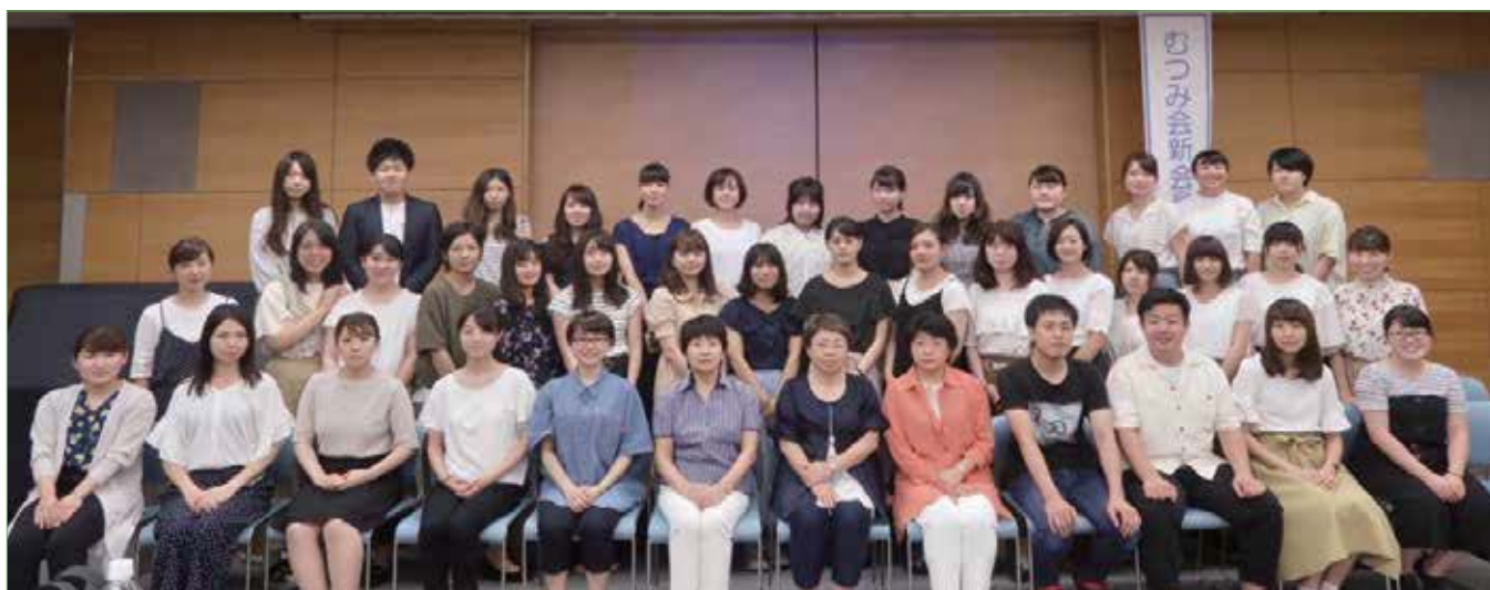
〈これから一緒に働く仲間達です!〉

看護の楽しさと厳しさを日々感じながら、一人一人が輝く笑顔で、患者さんに信頼される看護師に成長できることを期待しています。（広報親睦委員会 委員長）