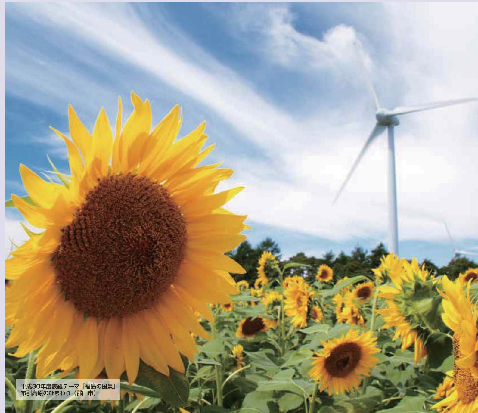
平成30年度表紙テーマ「福島風景」 布引高原のひまわり（郡山市）