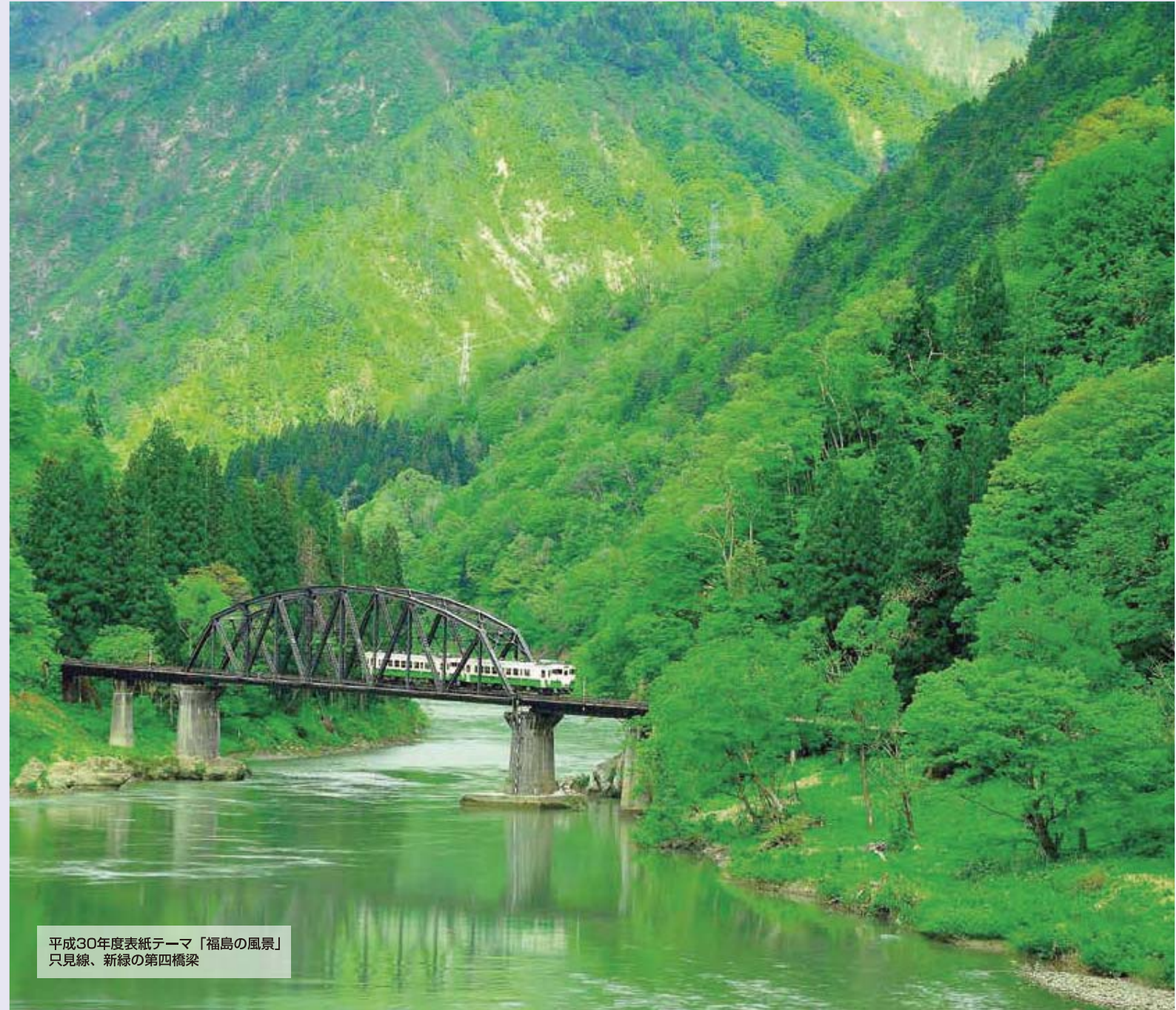
平成30年度表紙テーマ「福島の風景」 只見線、新緑の第四橋梁