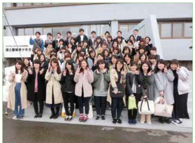
〈新入職員全員集合〉