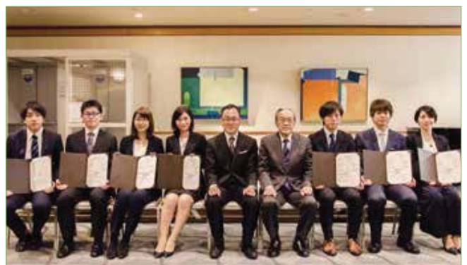
〈修了された7名の先生と湯浅理事長、金澤院長〉