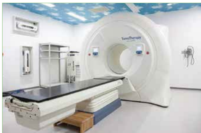
〈当院で使用しているトモセラピー〉