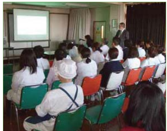
〈全体研修会の様子〉