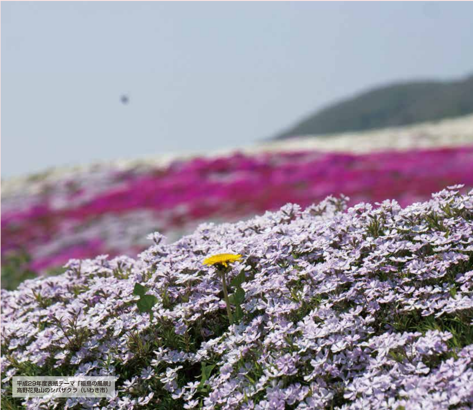
平成29年度表紙テーマ「福島の風景」 高野花見山のシバザクラ（いわき市）