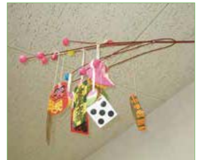
〈出来上がった団子さし〉