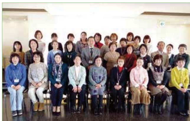
〈ボランティアさんとの集合写真〉