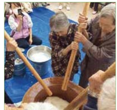
〈餅つきの様子、ご利用者は千本杵でヨイショ!〉