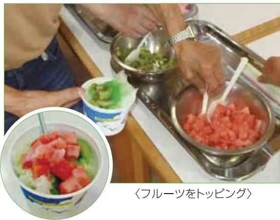
〈フルーツをトッピング〉