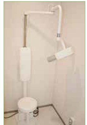
〈歯科用レントゲン装置〉