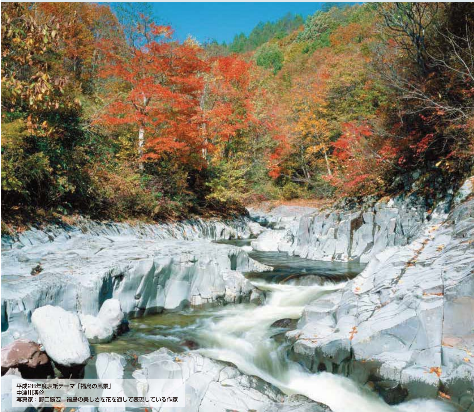
平成28年度表紙テーマ「福島の風景」 中津川渓谷 写真家：野口勝宏 福島の美しさを花を通して表現している作家