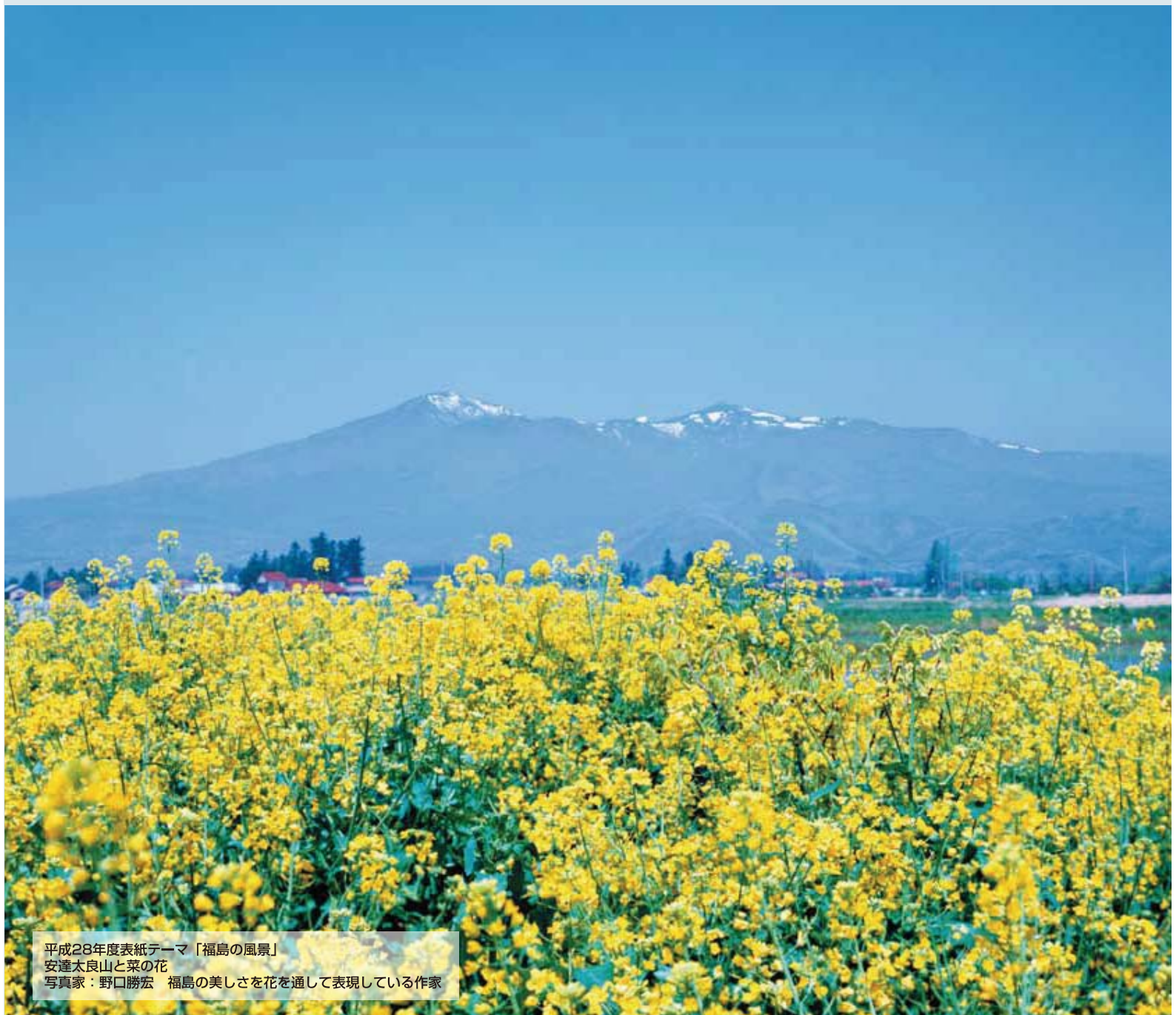
平成28年度表紙テーマ「福島の風景」 安達太良山と菜の花 福島の美しさを花を通して表現している作家