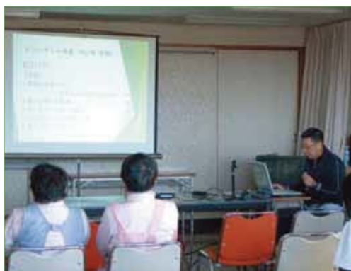
〈リハビリテーション室の発表場面〉