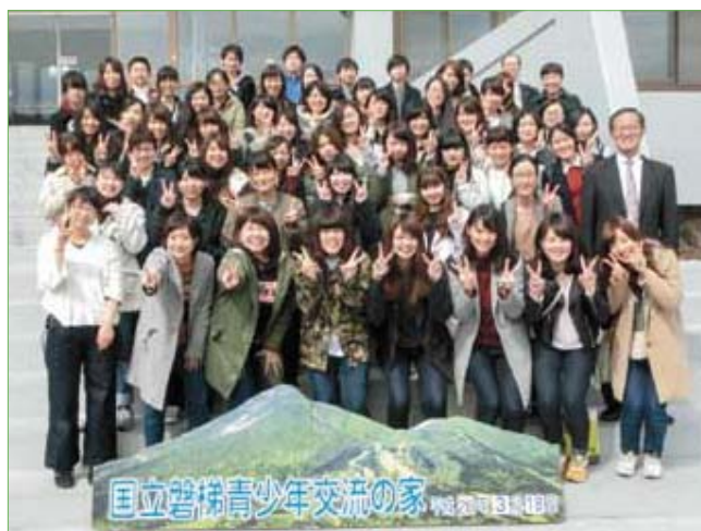
〈新人職員全員集合〉