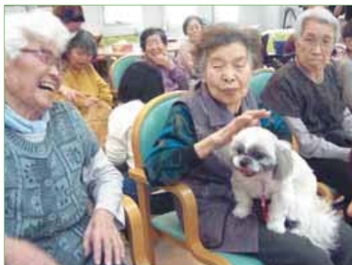
〈このわんちゃんかわいいワン!〉