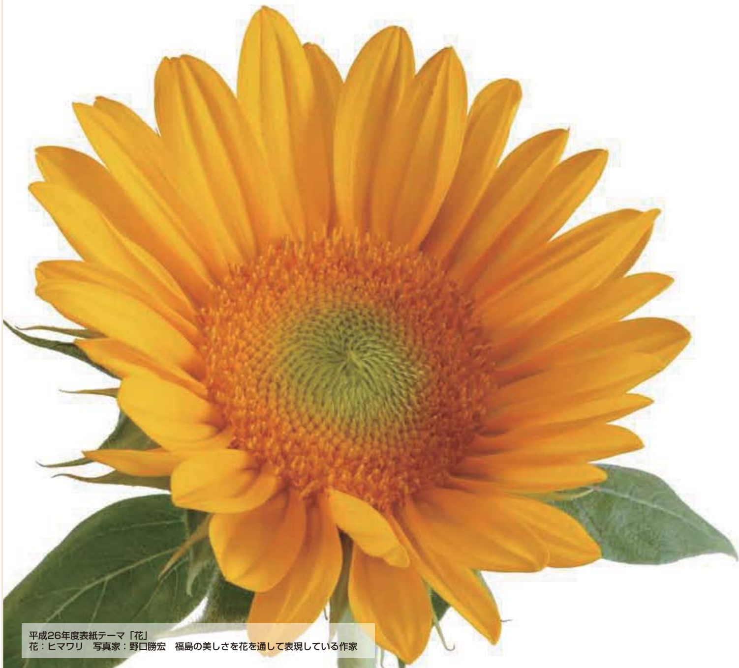
平成26年度表紙テーマ「花」 花：ヒマワリ 写真家：野口勝宏 福島的美しさを花を通して表現している作家