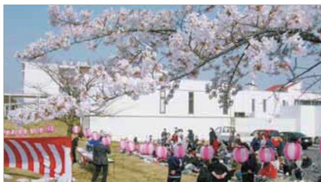
〈満開の桜の下でのお花見〉