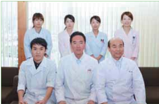
〈先生方とスタッフのみなさん〉