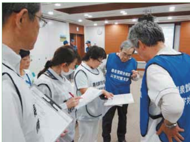
〈情報センターの様子〉