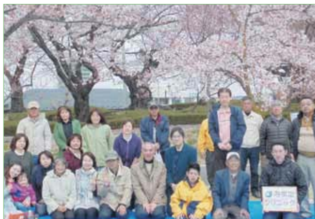
〈開成山公園にてお花見〉