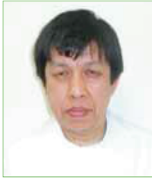
リウマチ膠原病内科 部長