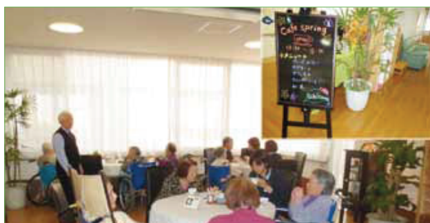
〈café springのメニューと店内の様子〉