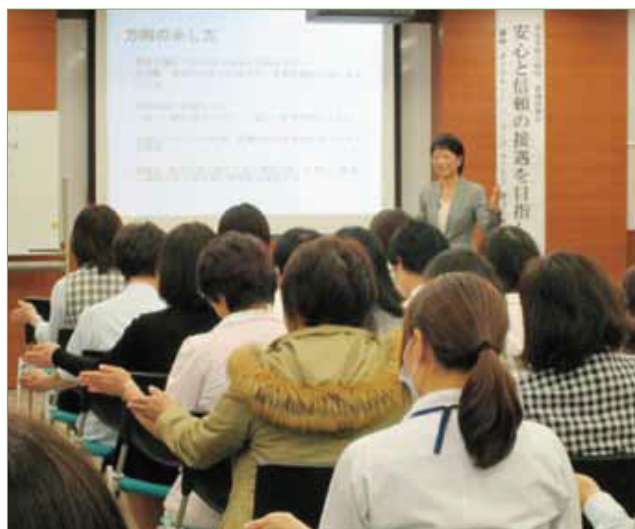
〈実演の様子(方向の示し方)〉