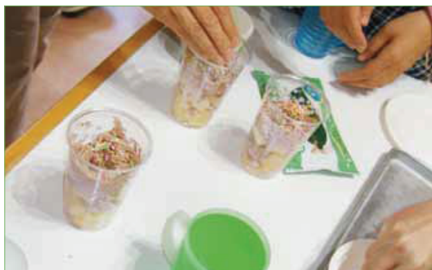
〈チョコバナナパフェの調理中〉