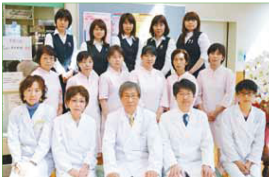
〈先生方とスタッフのみなさん〉