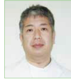
整形外科 部長 (リハビリテーション科部長)