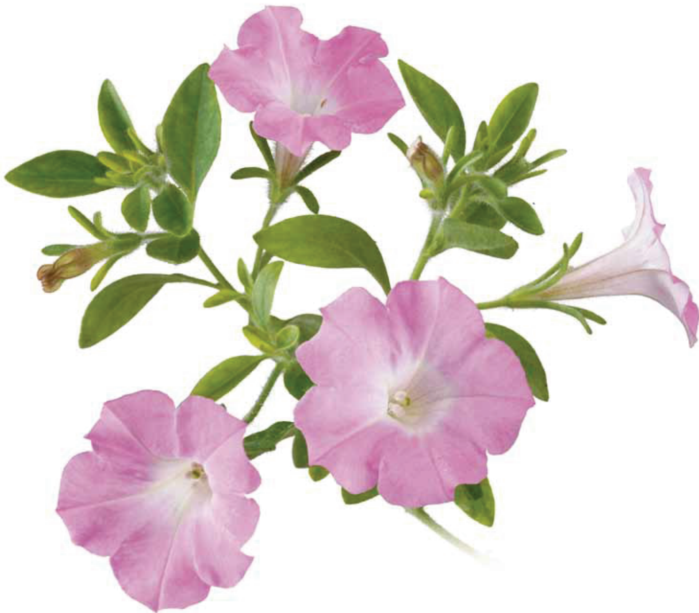
平成26年度表紙テーマ「花」 花：ペチュニア 福島のみさを花を通して表現している作家