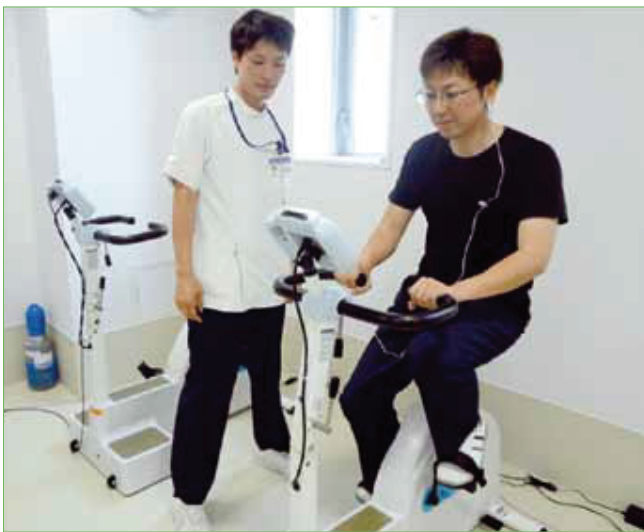
〈自転車エルゴメータ〉

※入院患者さんには毎週月曜日と木曜日に糖尿病教室を開催しており、その中の一部で運動療法を指導しています。