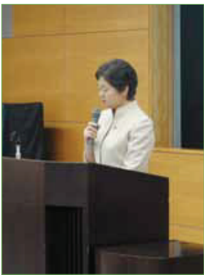
〈看護部長あいさつ〉