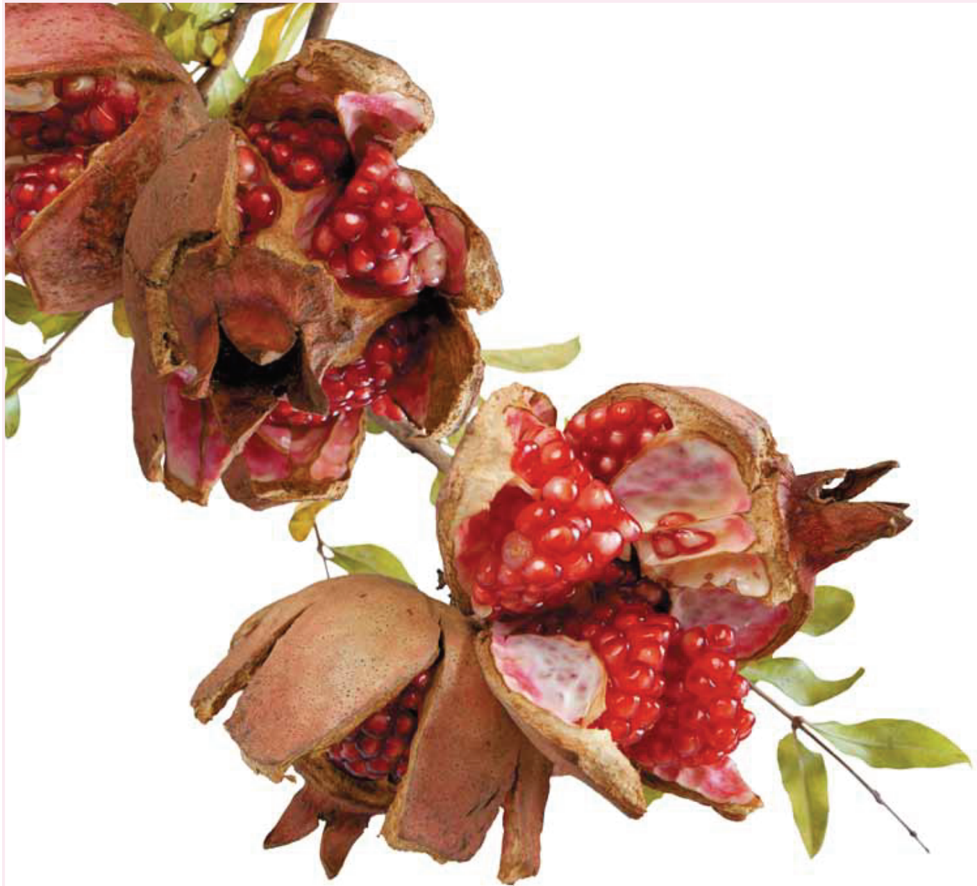
平成25年度表紙テーマ「花」 花：ザクロ 福島的美しさを花を通して表現している作家