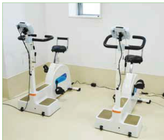
〈自転車エルゴメータ〉