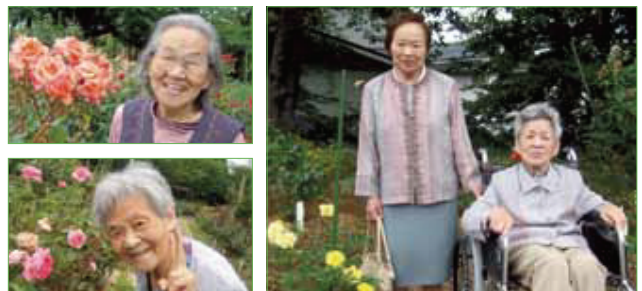
〈バラの花と私とどっちがきれいかしら?!〉