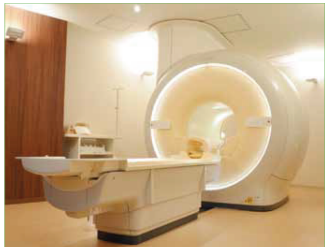
〈フィリップス社製 Ingenia3.0T-MRI〉