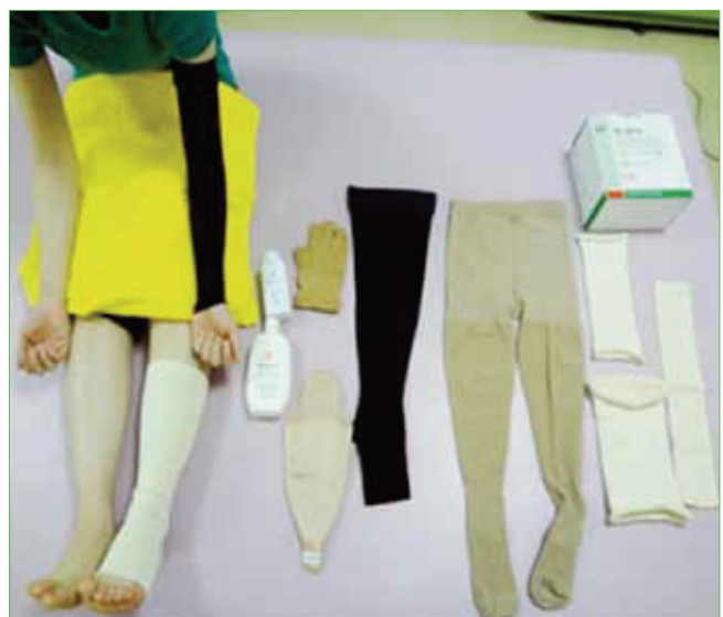
〈圧迫療法に使用する医療用品〉

むくみは、リンパ浮腫や心臓・腎臓の病気が原因で起こることがあります。また手術後や安静による筋力低下で起こることもあり、むくみの原因は様々です。主に乳がんや子宮・卵巣がんの手術後にみられるリンパ浮腫は歩行や日常生活・仕事での手の使用に障害をきたします。がんの終末期にみられるむくみは患者さんの苦痛となりますので、様々なむくみに対してむくみの軽減を目的に入院・外来でリハビリを行っています。また手術後には予防としてリンパ浮腫に対する情報提供やセルフケアの指導を行っています。具体的にリンパ浮腫治療はリンパドレナージ・圧迫療法・圧迫下での運動・スキンケアの4本柱で進めていきます。圧迫療法は弾性着衣や弾性包帯、tg-gripといったものを使用しています。入院生活や退院後の日常生活が不安・不自由なく過ごせるようサポートしながら関わっています。むくみでお困りの方は、お一人で悩まずに是非医師にご相談下さい。