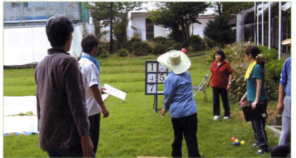
〈オリエンテーリングの一場面〉

解散後、行事が終わるのを待っていたかのように久しぶり の雨が降り始めました。 (リハビリテーション室 山本 剛三)