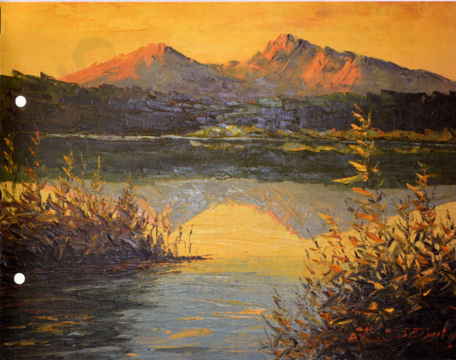
平成24年度表紙テーマ「病院内の絵画」 作品名：裏磐梯高原 展示場所：1F救急待合室