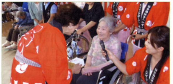
〈湯浅理事長から記念品を贈呈する場面〉