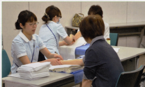
〈ハンドマッサージ〉