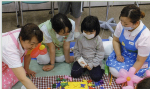
〈講演：年齢・発達段階に合わせたおもちゃの選び方〉

来年も、地域の方たちが気軽に参加し、看護のこころに触れ合えるような企画を考えますので、ぜひ、参加してください。