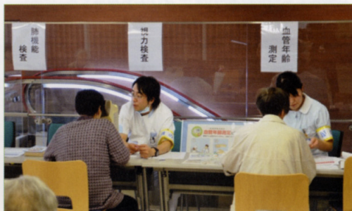
〈視力検査・血管年齢測定など〉

また、5階大会議室では、初めての試みで体験コーナーとして、AEDの使い方、15分でできるらくらく体操、ハンドマッサージ、妊婦疑似体験をして頂きました。午後からは、各病棟の看護師より「動脈硬化について」「目の病気について」「知って下さい。緩和ケア」「年齢・発達段階に合わせたおもちゃの選び方」「糖尿病と合併症について」ミニ講演を聞き、病気や看護に関心を深めてもらいました。