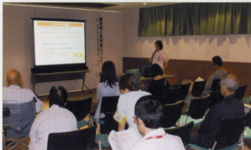
〈講演：糖尿病と合併症について〉