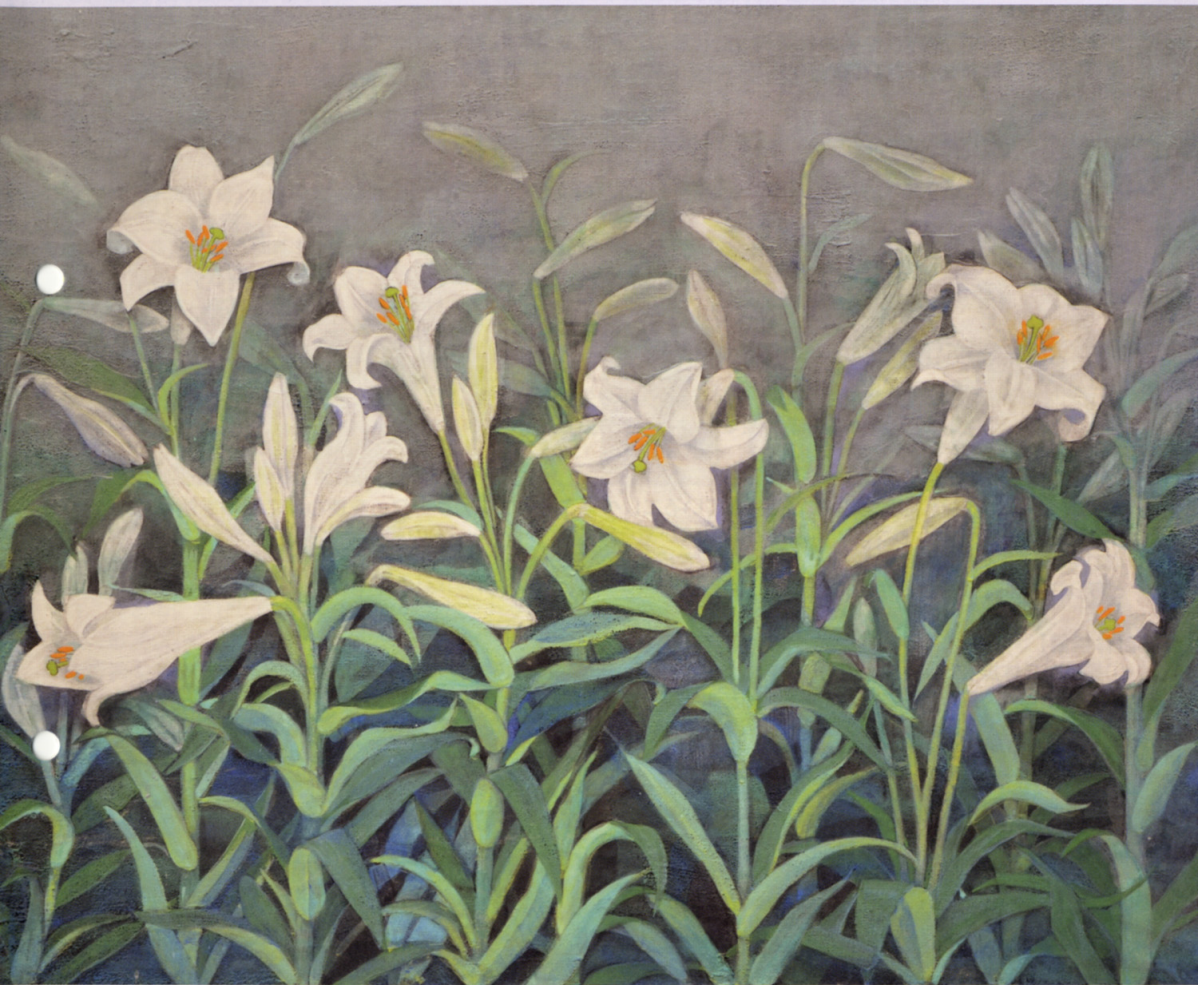
平成24年度表紙テーマ【病院内の絵画】 作品名：白南風(栃木県女性100人展入選) 作者名：阿由葉ミツエ 展示場所：1階案内