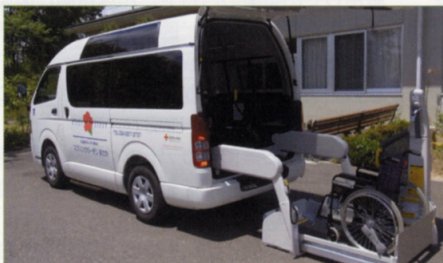
〈寄贈を受けた車両〉