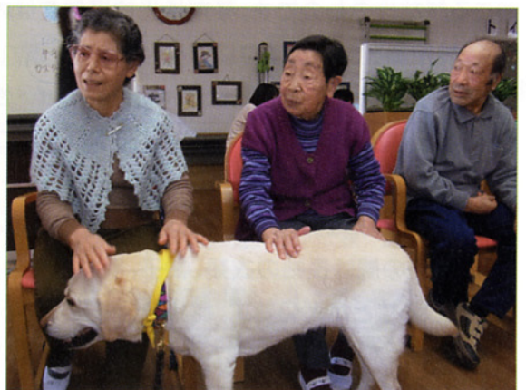
〈アニマルセラピーも実施します〉