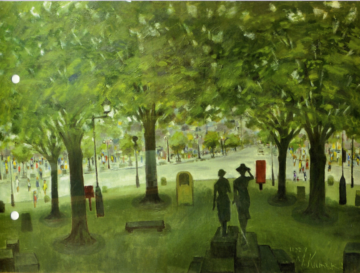
平成24年度表紙テーマ【病院内の絵画】 作品名：駅前フロンティア通り 作者名：久間木正範 展示場所：1階正面入口