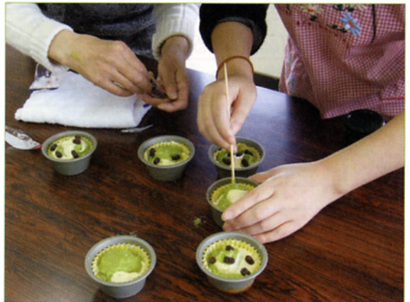
〈蒸しケーキ作りの様子〉