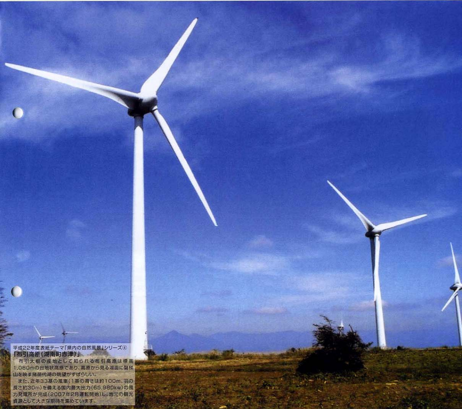
平成22年度表紙テーマ「県内の自然風景」シリーズ④ 「布引高原(湖南町赤津)」

布引大根の産地として知られる布引高原は標高1,080mの台地状高原であり、高原から見る湖面に盤梯山を映す猪苗代湖の眺望がすばらしい。