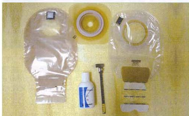
〈パウチとその付属品〉