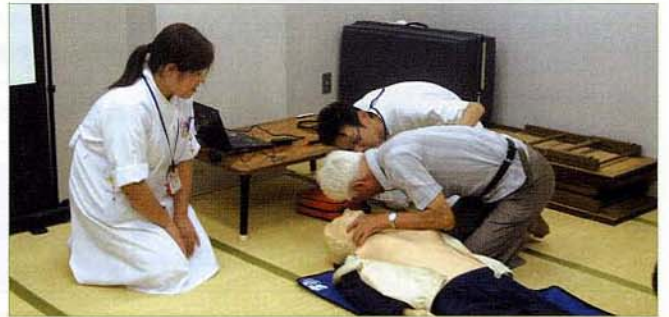
〈救急蘇生法の実際〉