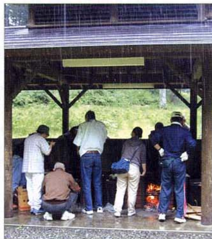
〈バーベキューの様子〉