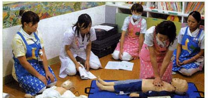
〈小児における救急蘇生法〉