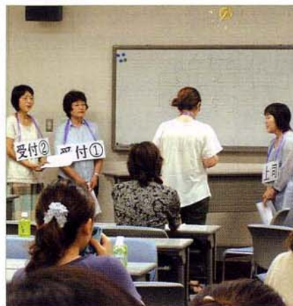
〈平成22年度ロールプレイング研修会〉