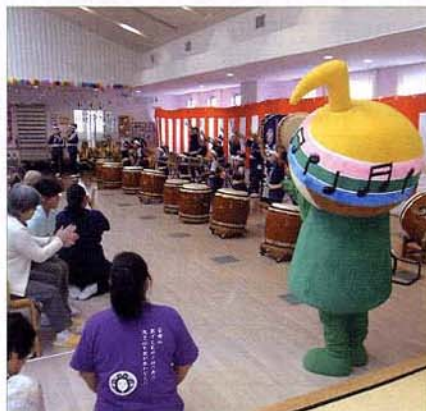
〈イベント風景(うねめ太鼓とがくとくん)〉