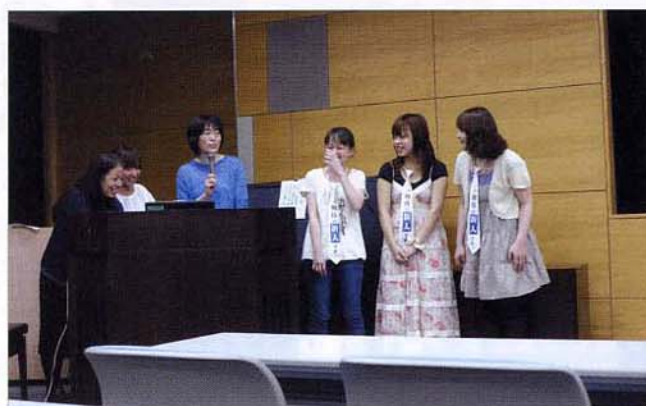
〈先輩看護師が新人看護師を紹介しています〉