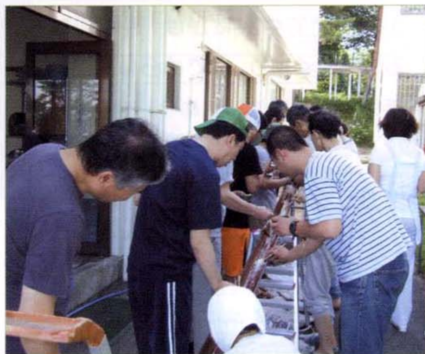
〈流しそうめんの様子〉

第3病棟(開放病棟)では、そうめんの他に中華めんも流しその食感の違いを楽しんだり、時にプチトマトが流れてきたりと楽しい流しそうめんとなったようです。(リハビリテーション室 山本 剛三)