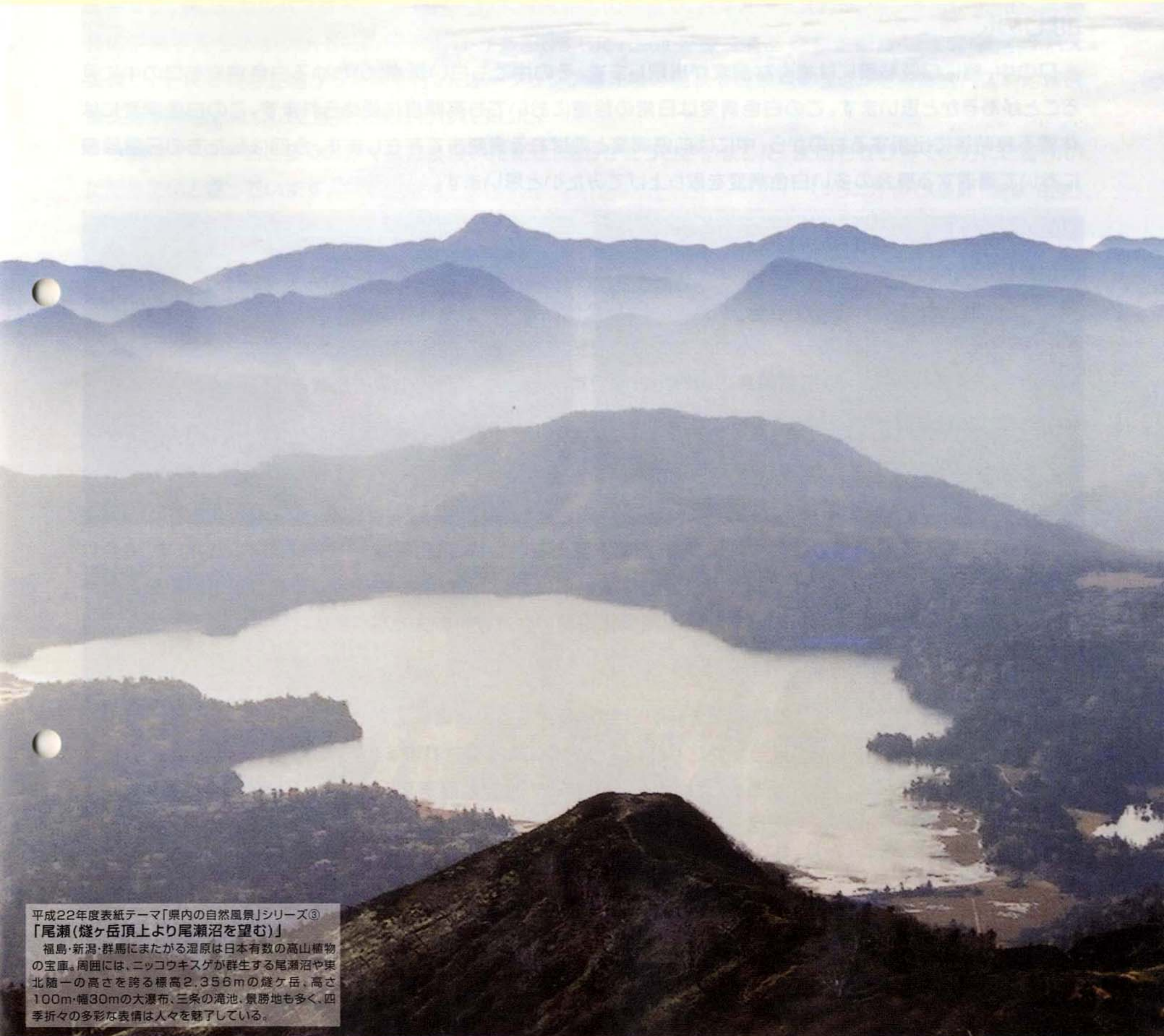
平成22年度表紙テーマ「県内の自然風景」シリーズ③ 「尾瀬(燧ヶ岳頂上より尾瀬沼を望む)」

福島・新潟・群馬にまたがる湿原は日本有数の高山植物の宝庫。周囲には、ニッコウキスゲが群生する尾瀬沼や東北随一の高さを誇る標高2,356mの燧ヶ岳、高さ100m・幅30mの大瀑布、三条の滝池、景勝地も多く、四季折々の多彩な表情は人々を魅了している。