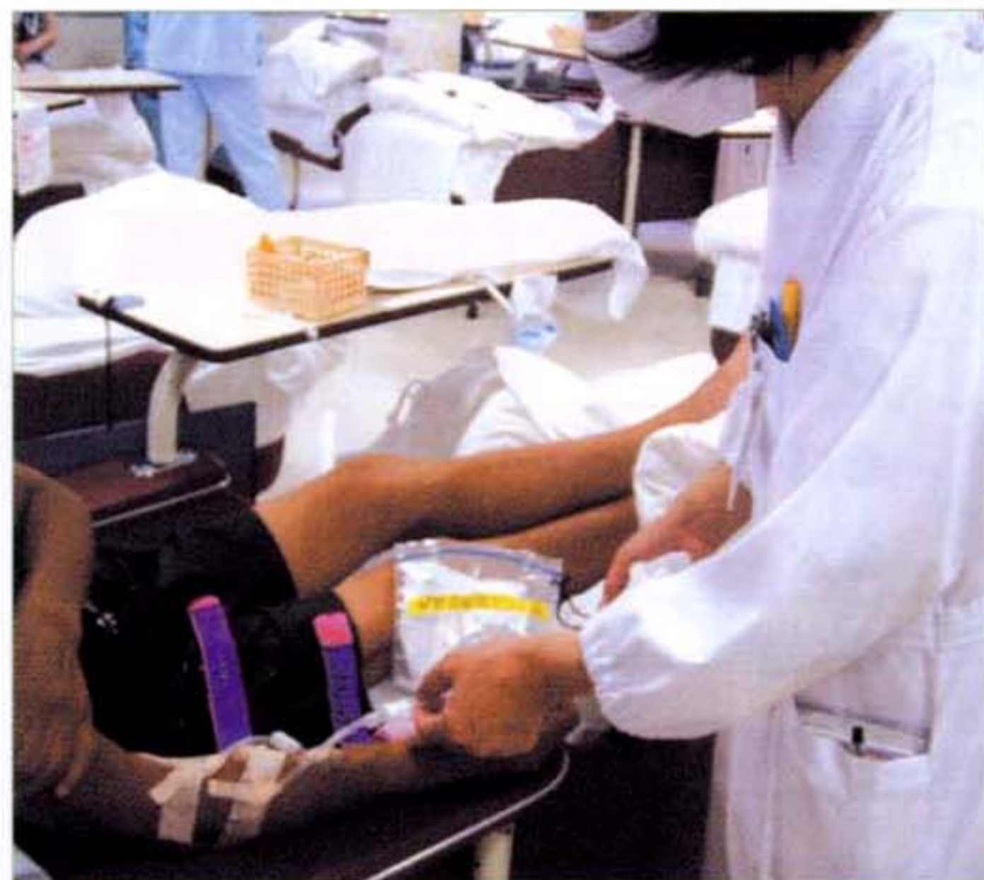
〈緊急離脱法指導の様子〉