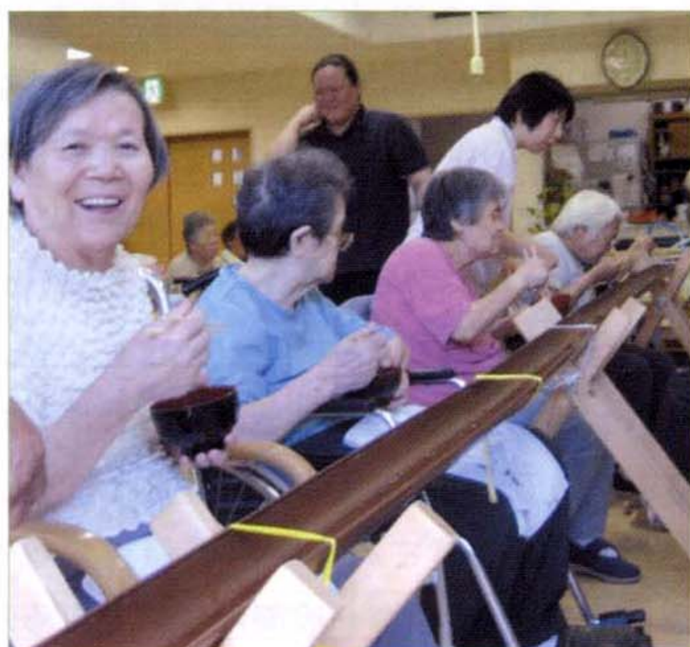
〈流しそうめんを楽しむ利用者〉