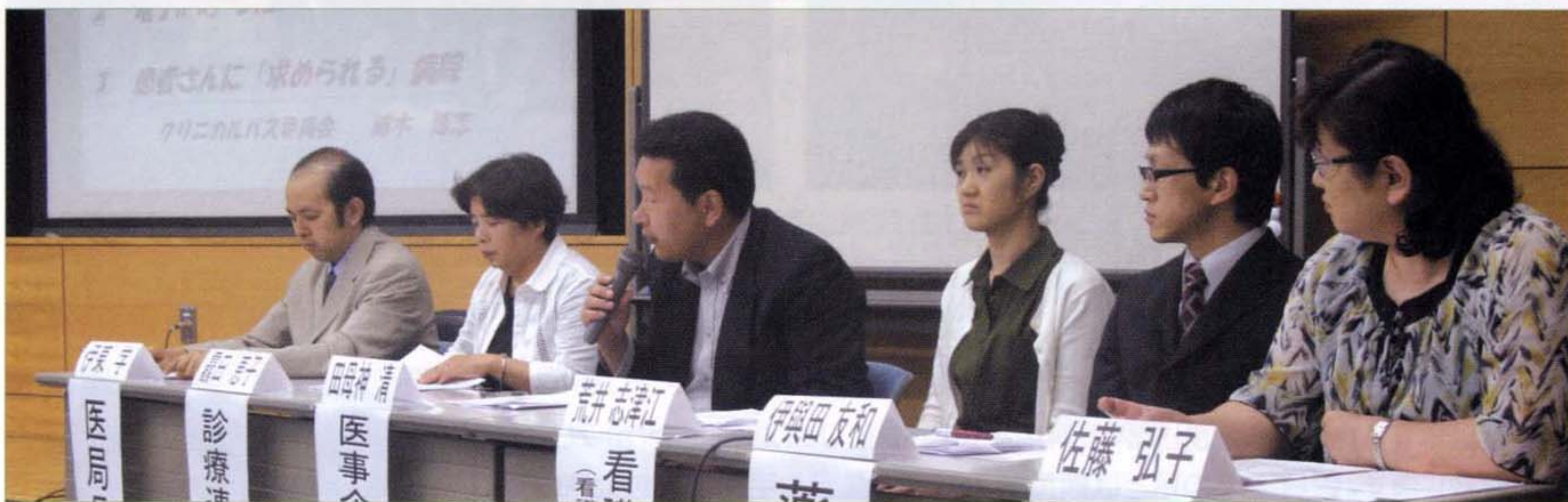
〈パネルディスカッション〉