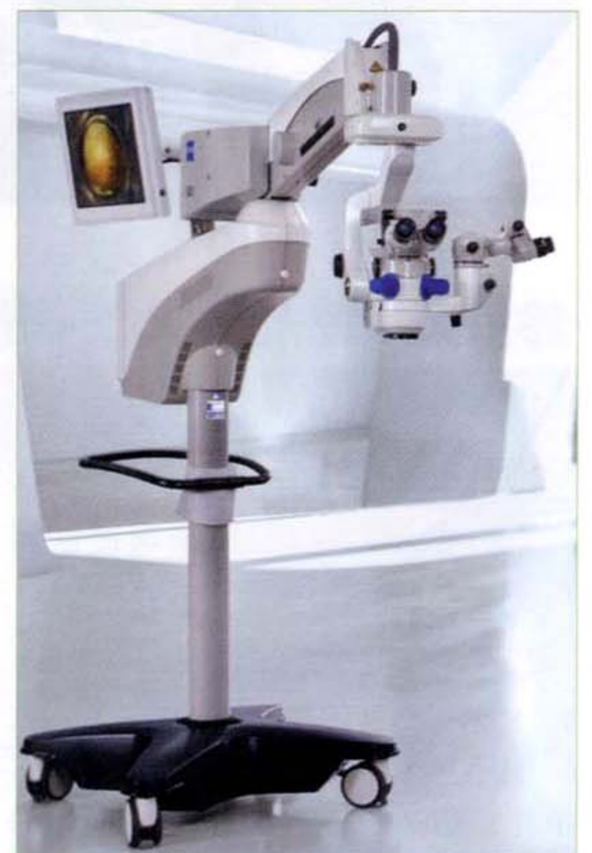
〈眼科用手術顕微鏡・OPMI Lumera 700〉