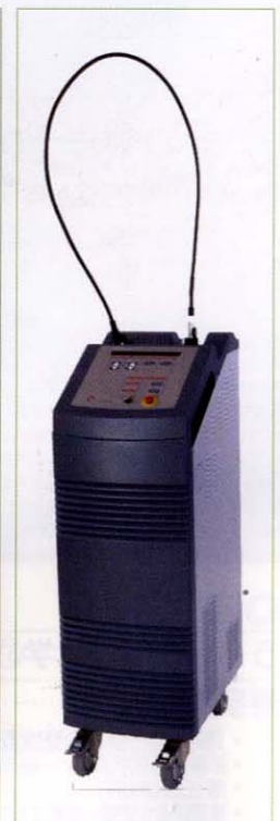
〈Qスイッチレーザー「ALEXLAZR」〉