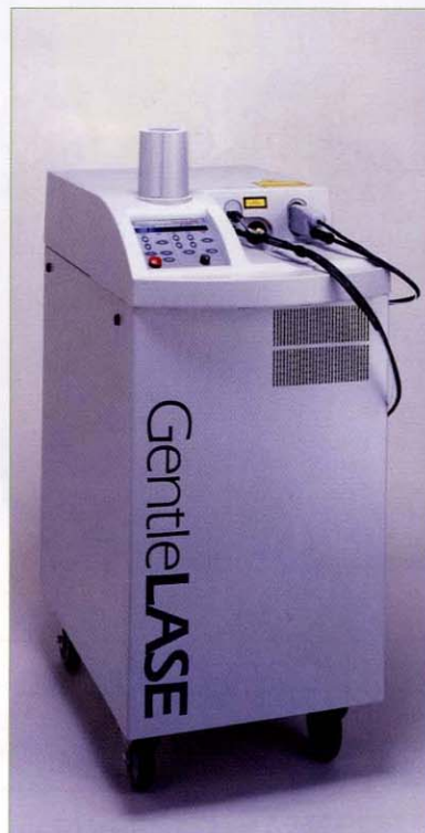
〈アレキサンドライトレーザー「GentleLASE」〉