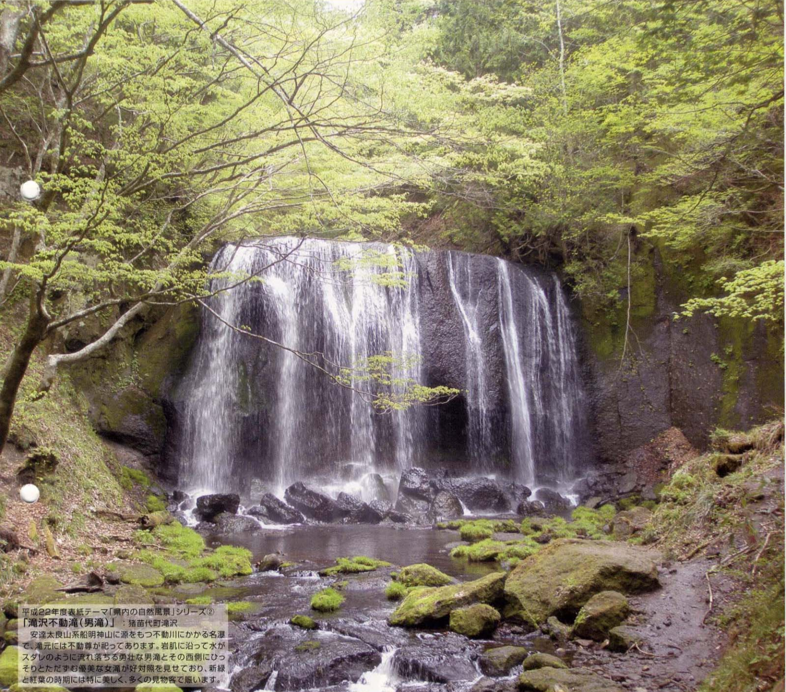
平成22年度表紙テーマ「県内の自然風景」シリーズ② 「滝沢不動滝(男滝)」：猪苗代町滝沢 安達太良山系船明神山に源をもつ不動川にかかる名瀑で、滝元には不動尊が祀っております。岩肌に沿って水がスグレのように流れ落ちる勇壮な男滝とその西側にひっそりとたたずむ優美な女滝が好対照を見せており、新緑と紅葉の時期には特に美しく、多くの見物客で賑います。