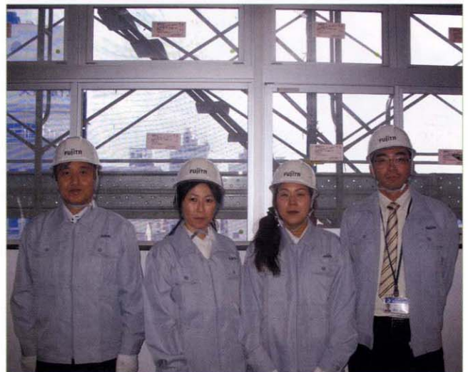
〈新病院建設準備室スタッフ〉