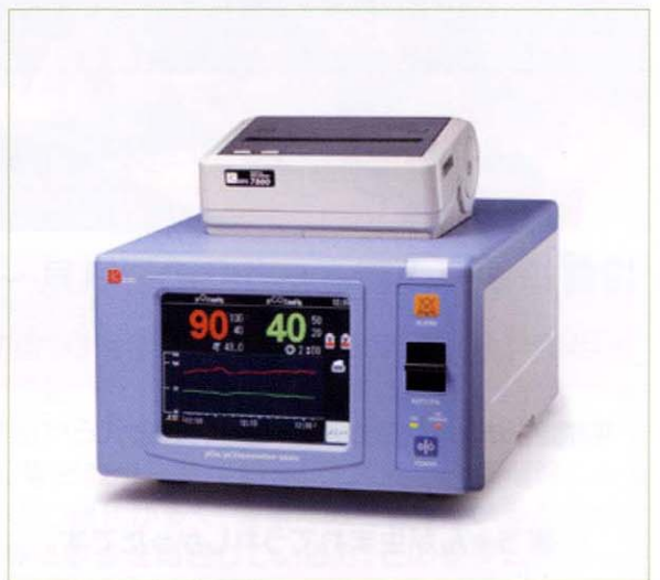
〈pO 2 /pCO 2 モニタ9200〉