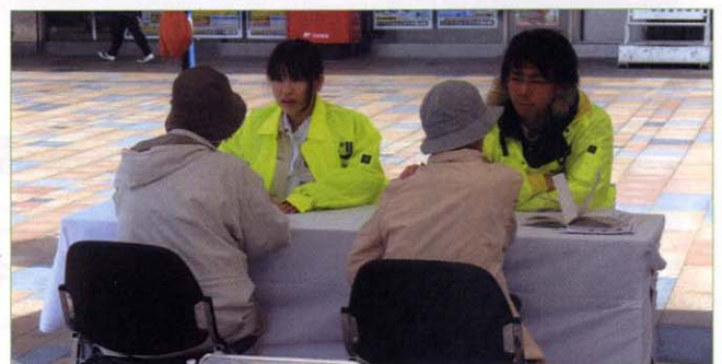
〈医師による健康相談〉