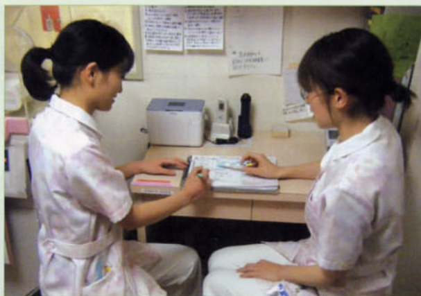
〈勤務の引き継ぎ中〉