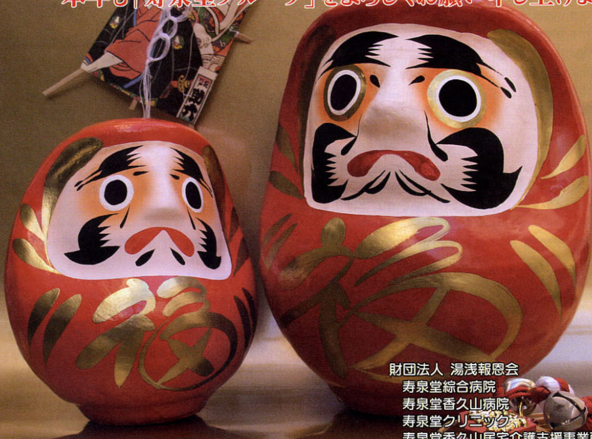
「白河だるま」 「白河だるま」は今から300有余年前、当時の白河城主丹羽長重公により、城下の繁栄を強く願って作られ、「白河鶴亀松竹梅だるま」と言って眉毛は鶴、髭は亀、耳髭は松と梅、アゴ髭は竹を表し、その意匠のすぐれた点が重視され、その優美さはみちのく民芸には珍しく縁起良く、品の良さは日本一であると言われていました。 大願成就だるまとも言われ、思い思いの願いをこめて左目(向かって右側)に目を入れ、願いがかなった時に、もう片方の目を入れる風習があります。

財団法人 湯浅報恩会 寿泉堂総合病院 寿泉堂香久山病院 寿泉堂クリニック 寿泉堂香久山居宅介護支援事業所 寿泉堂香久山通所リハビリテーション事業所 いずみ訪問看護ステーション 社会福祉法人 いずみ福祉会 介護老人福祉施設 スプリングガーデンあさか 特定医療法人 為進会 寿泉堂松南病院