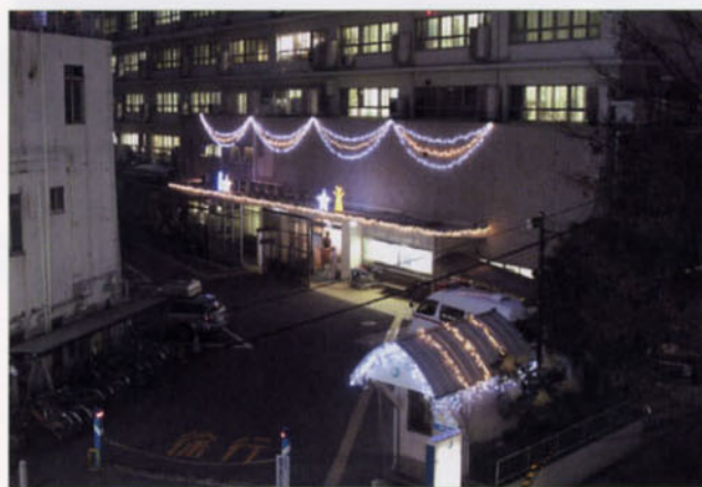
〈イルミネーション〉

このイルミネーションは、郡山駅前で開催中のビッグツリーページェントにあわせて1月末まで実施する予定です。お近くをお通りの際は、ぜひ足をとめて光輝くイルミネーションをご覧になってみてください。(企画部)