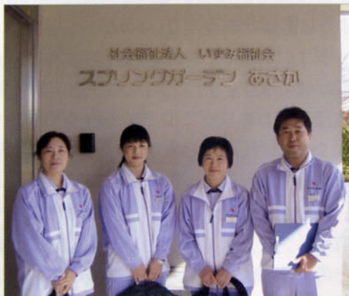
〈常勤職員の皆さん〉