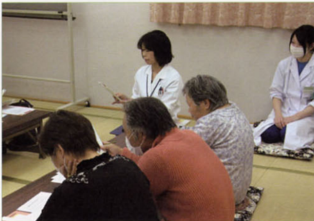
〈管理栄養士による栄養指導〉