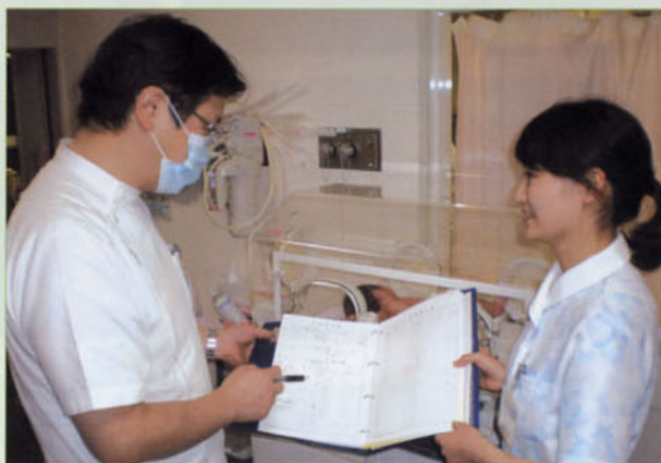
〈和夫先生と指示の確認〉