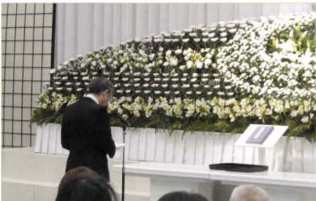
〈二宮院長の追悼のこたば〉