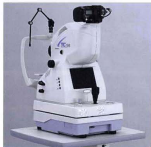
〈無散瞳眼底カメラ「NWB」〉