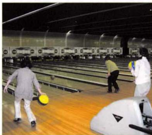
〈ボウリング大会の様子〉