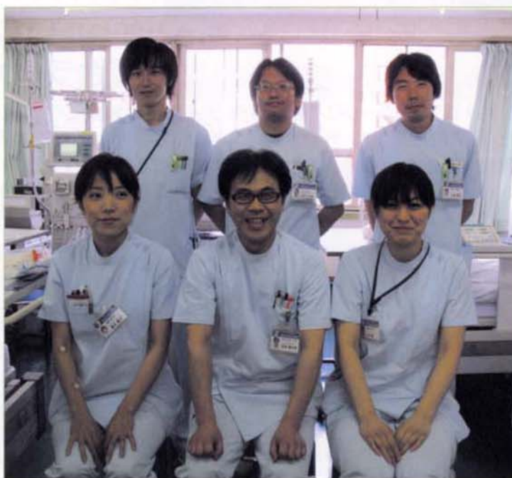
〈臨床工学科スタッフ〉