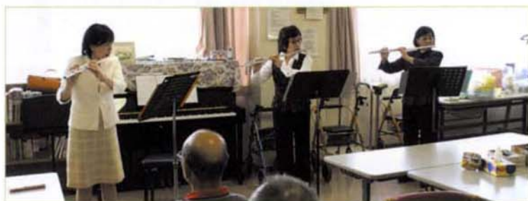
〈コンサートの様子〉