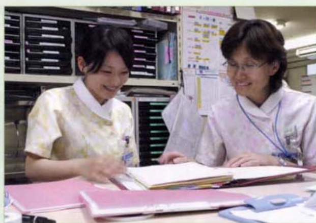
〈指示受けの指導中〉