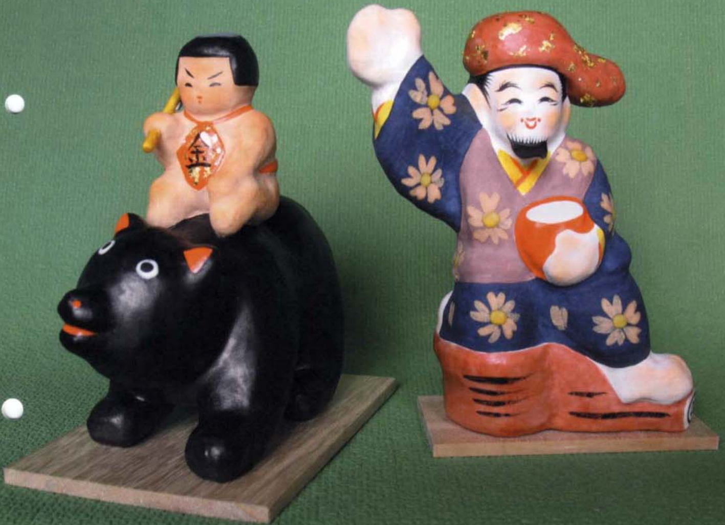
「船引張子人形」 人形師・桑島 巨良氏 船引町の鎮守「大嶋神社」の神職の子息として船引町に生まれ、伝統ある三春人形師に入門し、その技術を習得する一方、博多人形の彩色を研究し、その二者の長所を併せ持った新しい感覚の「船引張子人形」の創始者である。