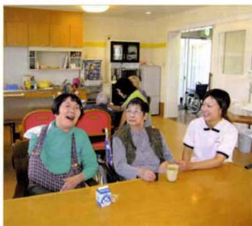
〈共同生活室の様子〉