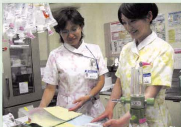
〈薬剤のダブルチェック〉