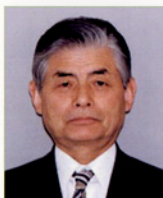
寿泉堂クリニック