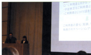
〈学習療法発表会の様子〉