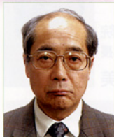
寿泉堂香久山病院