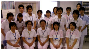
〈回復期リハビリテーション病棟スタッフ〉