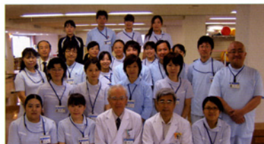
〈医師・コメディカル部門スタッフ〉

●TEL: 024-932-6368(代) ●FAX: 024-922-7178 ●Eメール: renkei@kaguyama.jp