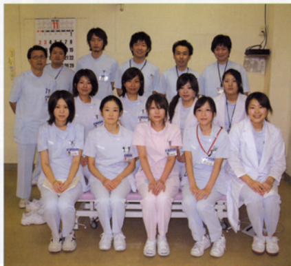
〈リハビリテーション科スタッフ〉