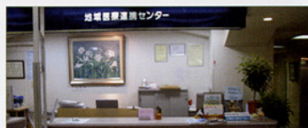
〈地域医療連携センター窓口(病院入口)〉

広報誌「うららか」に掲載してあります「登録医師のご紹介」で、毎回地域の先生方をご紹介しております。開放型病院として、地域の先生方が診療所と病院の連携を推進し、地域医療の向上を図るため、院内医師と共同で診療にあたっております。私達診療連携室職員も、患者さんに最適な医療をスムーズに提供できるように、地域の先生方と協力をして、業務を行っていききたいと思います。