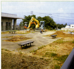
〈増築予定地の施設中庭〉