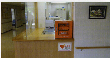
(AED=自動体外式除細動器)