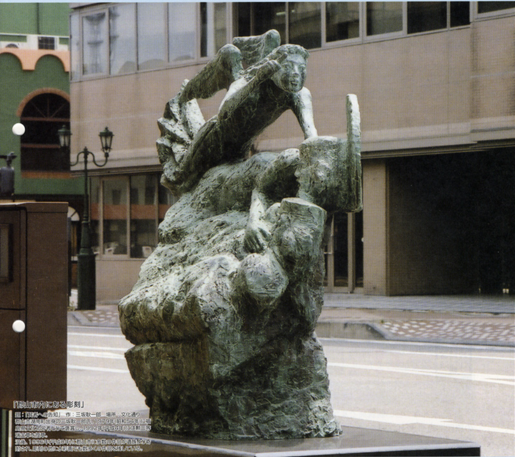
「郡山市内に彫る彫刻」

題名「郡山に彫る彫刻」 作：三坂敏一郎 場所：文化通り 郡山駅前通町交差点の三坂敏一郎氏（1939年10月15日生）は、 彫刻家として活躍し、1999年、第1回「郡山に彫る彫刻」の 実行委員を務めた。