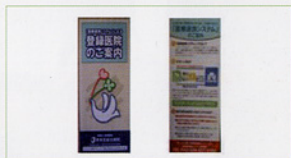
〈医療連携システムによる登録医師のご案内〉(ハフレット)