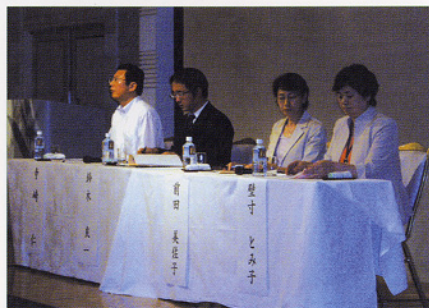
〈パネルディスカッション〉