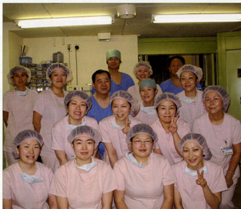
(中央手術室スタッフ)