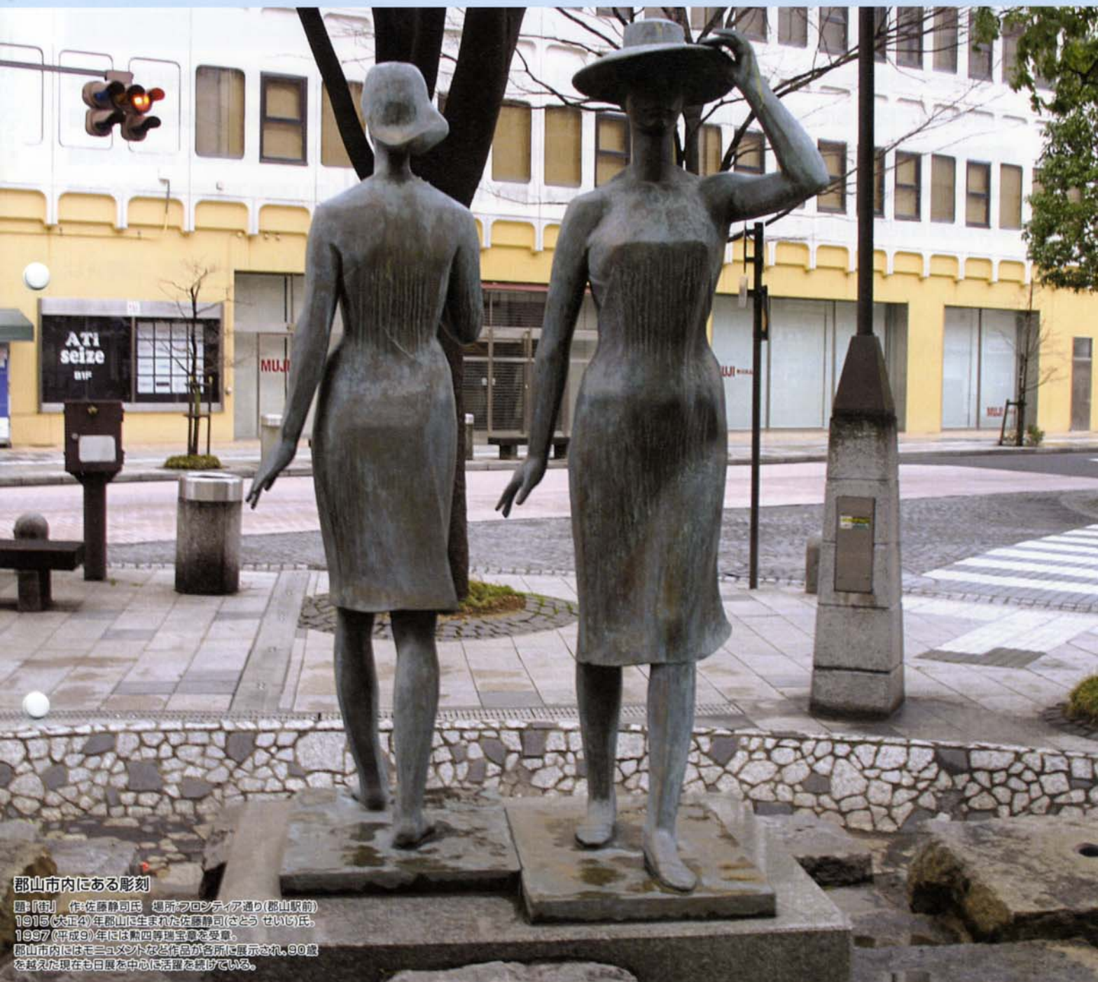
郡山市内にある彫刻

題：『街』 作：佐藤静司氏 場所：フロンティア通り（郡山駅前） 1915（大正4）年郡山に生まれた佐藤静司（さとう せいじ）氏。 1997（平成9）年には勲四等瑞宝章を受章。 郡山市内にはモニュメントなど作品が各所に展示され、90歳 を越えた現在も日展を中心に活躍を続けている。