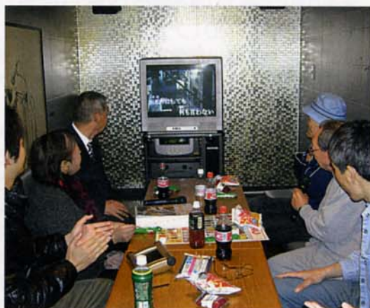
〈カラオケでの1コマ〉