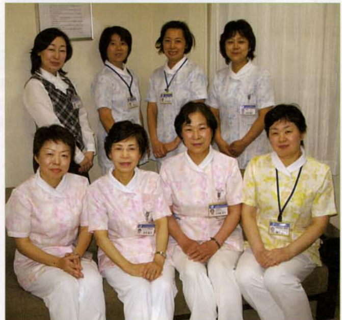
〈看護管理科スタッフ〉