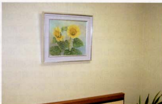
〈壁に掛けた“ヒマワリ”〉