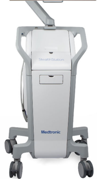
ナビゲーションシステム本体