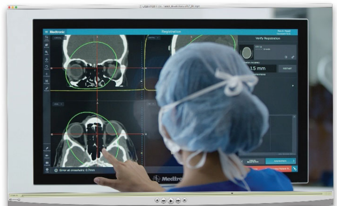
レジストレーション(位置合わせ)画面。緑の楕円内が高信頼性範囲を示している。

当院においては以前より鼻副鼻腔手術に積極的に取り組んでおります。難治性の鼻副鼻腔炎でお困りの患者さんがいらっしゃいましたら、是非ご相談ください。